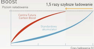
Testy laboratoryjne wykazały, że ładowanie akumulatora Centra Futura Carbon Boost trwa zdecydowanie krócej niż ładowanie standardowego akumulatora w takich samych warunkach.

W wyniku rozładowywania akumulatora nieprzewodzące cząsteczki siarczanów stopniowo pokrywają płyty ujemne, izolując je od elektrolitu. W takiej sytuacji duża ilość energii jest wykorzystywana na rozpuszczenie siarczanów, co obniża efektywność ładowania. Wysoko powierzchniowy węgiel w akumulatorach Centra Futura Carbon Boost zapewnia doskonałe przewodnictwo, dzięki czemu siarczany rozpuszczają się znacznie szybciej.