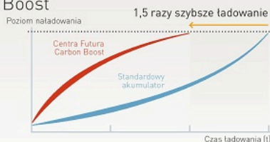
Testy laboratoryjne wykazały, że ładowanie akumulatora Centra Futura Carbon Boost trwa zdecydowanie krócej niż ładowanie standardowego akumulatora w takich samych warunkach.

W wyniku rozładowywania akumulatora nieprzewodzące cząsteczki siarczanów stopniowo pokrywają płyty ujemne, izolując je od elektrolitu. W takiej sytuacji duża ilość energii jest wykorzystywana na rozpuszczenie siarczanów, co obniża efektywność ładowania. Wysoko powierzchniowy węgiel w akumulatorach Centra Futura Carbon Boost zapewnia doskonałe przewodnictwo, dzięki czemu siarczany rozpuszczają się znacznie szybciej.